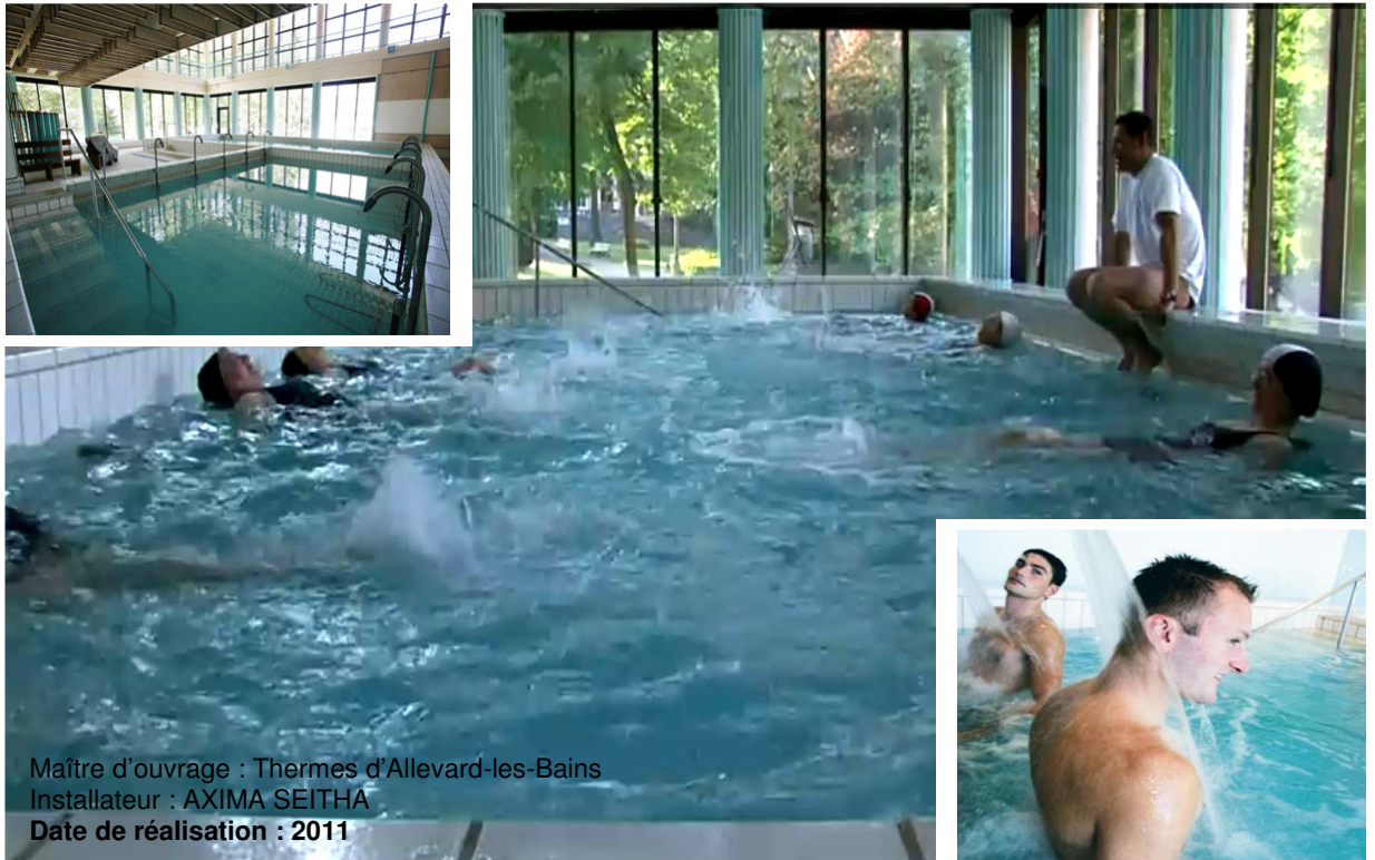
Maître d'ouvrage : Thermes d'Allevard-les-Bains Installateur : AXIMA SEITHA Date de réalisation : 2011