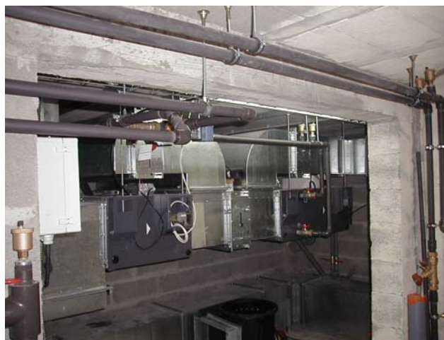
Eco Modul F

Grâce à ce système ECOENERGIE, on peut apprécier une maîtrise totale des consommations énergétiques.