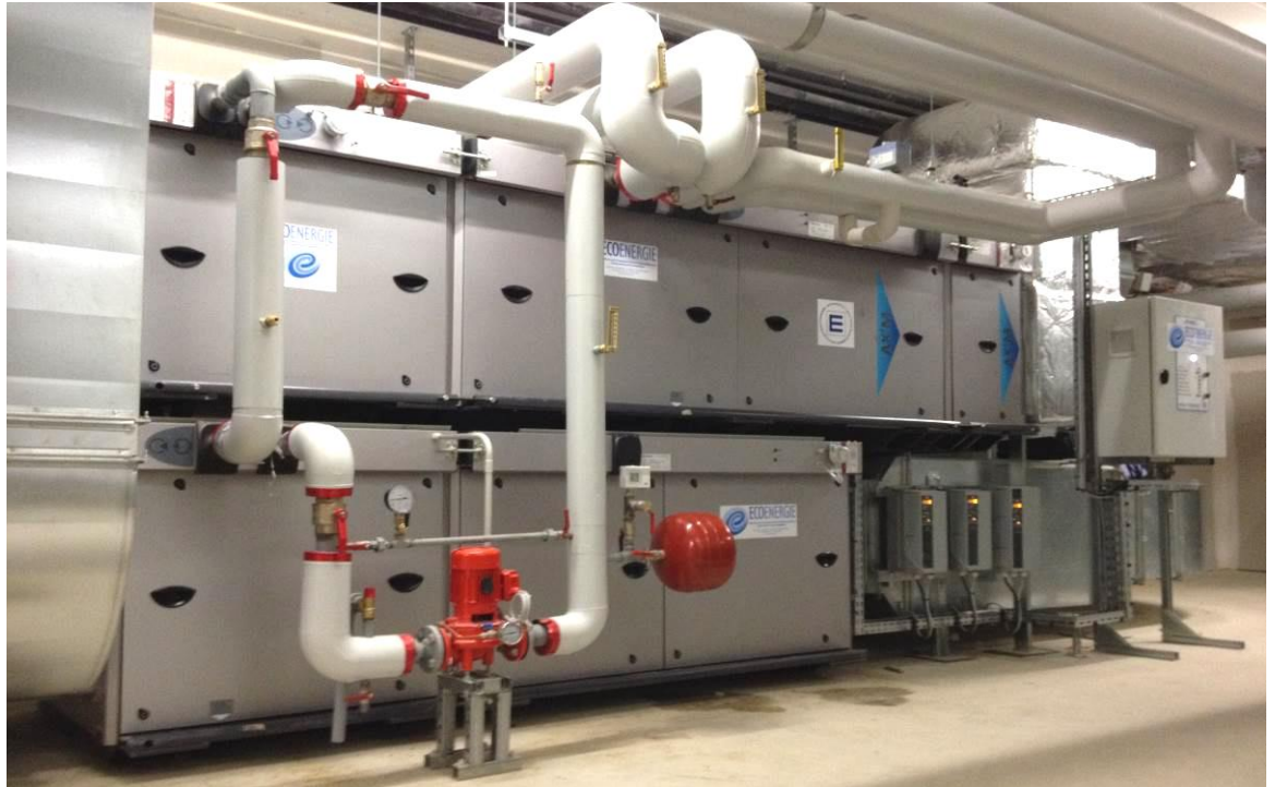
EcoModug+75 Basique 4 : Principe hydraulique

Le chauffage, le rafraîchissement, le brassage, la ventilation et la déshumidification du hall bassin sont assurés par un système de traitement d'air et de déshumidification par modulation d'air neuf avec récupération d'énergie (MAN+) de type « ECOMODUG+ 75 BAS 4 ».