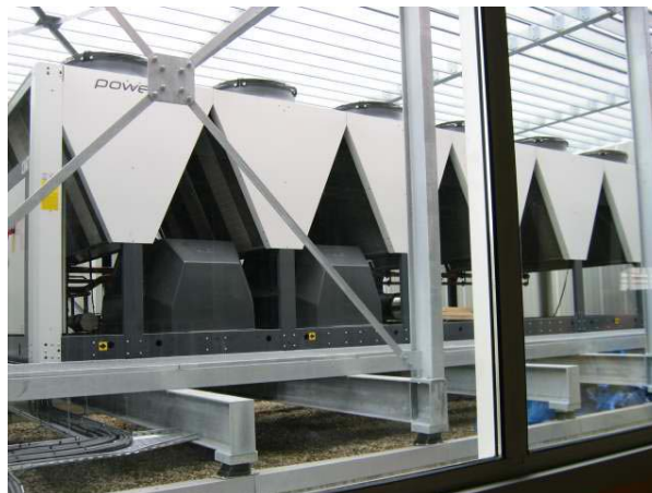
Groupe de production d'eau glacée