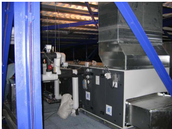
Centrales de traitement d'air