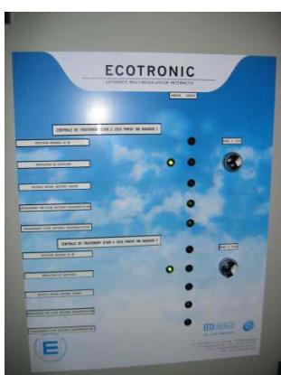
Armoire de commande et régulation